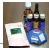
※お土産の一例 (季節によって切り替わります。)